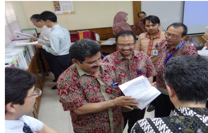
【ボゴール農科大学での実地審査】