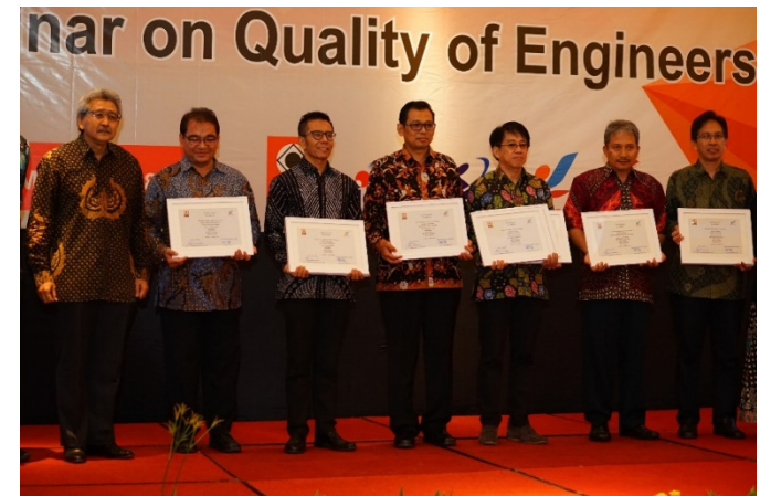
【IABEE認定修了証書授与式】