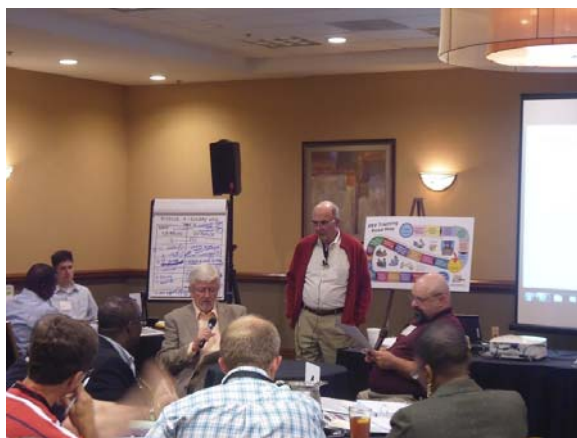
図 ロールプレーの様子

最終面談に先立つ、プログラム責任者 (学科長) への審査チームの非公式面談 (Informal debrief) の、研修会主催者が準備したロールプ