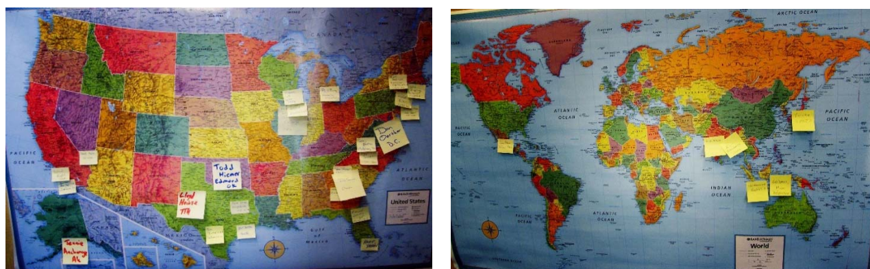
図 全米・世界から集う参加者（それぞれの名前を地図に貼る）

実地研修会は、日曜日朝に始まり、月曜日正午に終了する、実地審査を模擬する形式で行われました。会場は、ABET 本部の所在地ボルティモアで、空港近くのホテル会議室で行われ、50 名ほどの参加者が、5 名ずつに分かれてチームを作り、それぞれに認定審査経験豊富なメンターが付く形式でした。