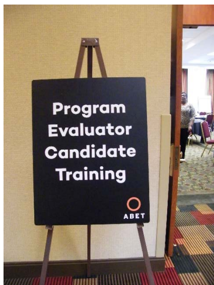
図 研修会会場入口