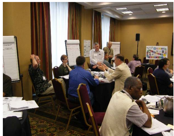
図 各テーブルに分かれての討論風景

日曜日の夜の会議は、事前に SSR (Self Study Report) を読んで各 PEV が感じた問題点と、日曜日の訪問で発見した問題点を確認し合うことが目的であると説明され、実際に各テーブル (チーム) でそのような問題点を出し合い、合意を形成する議論が行われました。右の写真は、グループ討論の様子です。