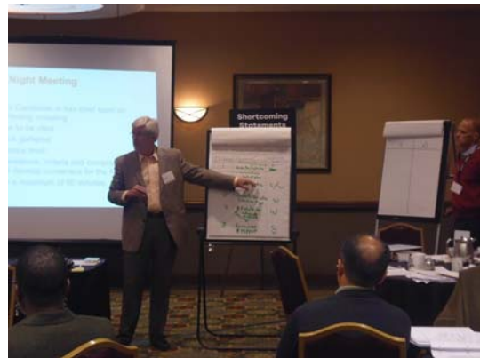
図 各チームの結果発表の様子

「今回の審査は架空のものであり、実際の科目のシラバスも、教員や学生も存在しない。そのため、ここに至る判断では、各チームは多くの仮定を置いたうえで判断している。この仮定が、判断がばらつく大きな原因である。実際の審査では、具体的な資料や、面談経験を共有するので、このような仮定は、ずっと少なくなり、判断のバラツキは、このように大きくはならない。」